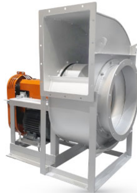
IMPELLER : BACKWARD CURVE